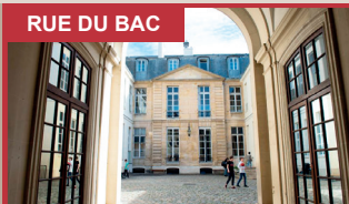
RUE DU BAC